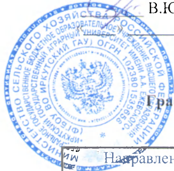
График экзаменационной сессии студентов заочной формы обучения на 2017-2018 учебный год (бакалавры)