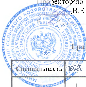
График экзаменационной сессии студентов заочной формы обучения на 2017-2018 учебный год (специалитет)